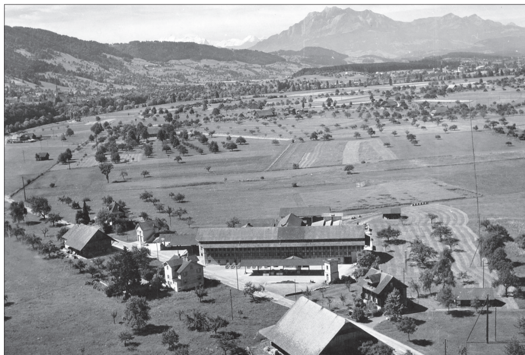
Körbligen mit Sicht gegen Süden um 1960. Die Kantonsstrasse verläuft noch durch das Firmenareal.