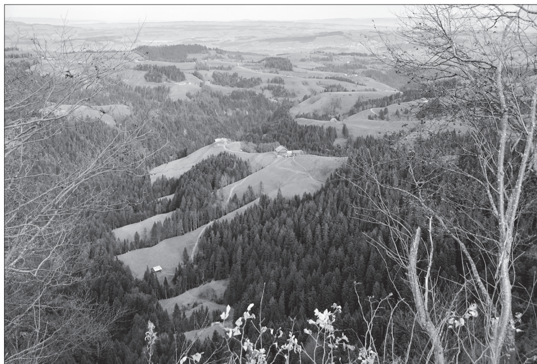
Rund 150 Jahre, von 1720 bis 1870, sind auf den Liegenschaften Ober (rechts) und Unter Mätteberg in Romoos Familien Schumacher, Vorfahren der Ziegeleibesitzer Körbligen, nachgewiesen. [Bild abt]