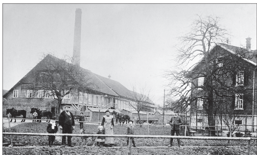
Die Familie Schumacher-Ineichen vor dem Betriebsgelände mit dem imposanten Kamin, 1907.